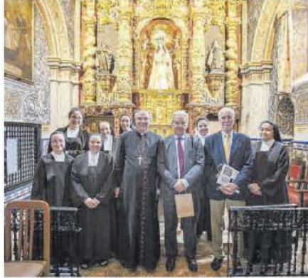
El convenio se firmó en la iglesia del convento.

POCOS INGRESOS / El convento se mantiene con los exiguos ingresos que logran con la distribu-