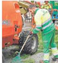
Los puestos se dividen en 18 categorías. HOY

El Servicio Extremeño Público de Empleo (Sexpe) realizará la preselección de los candidatos. En el