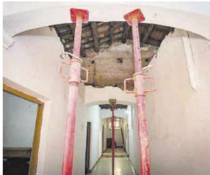
Vigas apuntalando parte de la techumbre de la segunda planta.

ción de las formas que hacen las Carmelitas de Talavera la Real, venden escapularios y realizan trabajos de planchado de purificadores, albas y manteles para las parroquias. «Entradas grandes no tenemos», reconoció. Jaraquemada, por su parte, mencionó que el mantenimiento ha sido siempre «reducido» por la falta de medios económicos. Emilio Vázquez defendió la vocación de la Fundación CB en la protección del casco histórico, si bien, no pudo menos que dirigirse al arzobispo para decirle que esta actuación «no es competencia nuestra» y abogó por que la Iglesia afronte el cuidado de su patrimonio. Celso Morga recogió el testigo al expresar que no sería entendible que de-