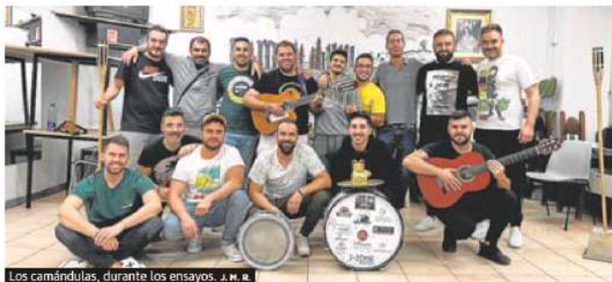
Los camándulas, durante los ensayos. J. M. R.

La Misa por los Difuntos en la explanada del cementerio municipal será mañana a las cinco. Si llueve, se trasladará a la capilla del tanatorio y se avisará con tiempo a los fieles para que puedan asistir a la celebración.