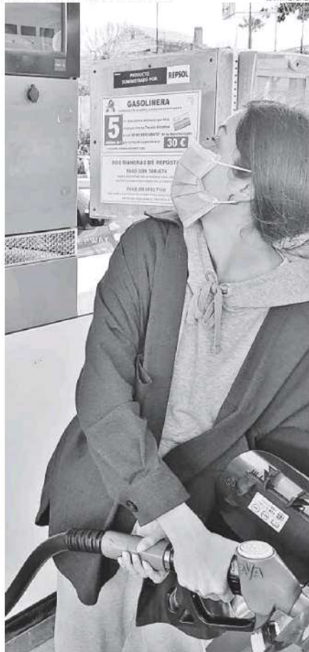
Una mujer llena el depósito de su vehículo.

La bonificación estatal corre a cargo de las arcas públicas excepto en el caso de las tres grandes, Repsol, Cepsa y BP, a las que el Estado devolverá 15 céntimos pero no el resto, si bien las estaciones de servicio denuncian que solo adelantar temporalmente ese importe les genera importantes problemas de tesorería, por lo que Mena del Pueyo considera que hubiera sido más apropiado reducir el precio de los carburantes de automoción «descontando» una parte de los impuestos o haber facilitado a las empresas el anticipo con anterioridad al comienzo de la aplicación de la medida, en lugar de provocarles los problemas de liquidez que están sufriendo y que las están «estrangulando»