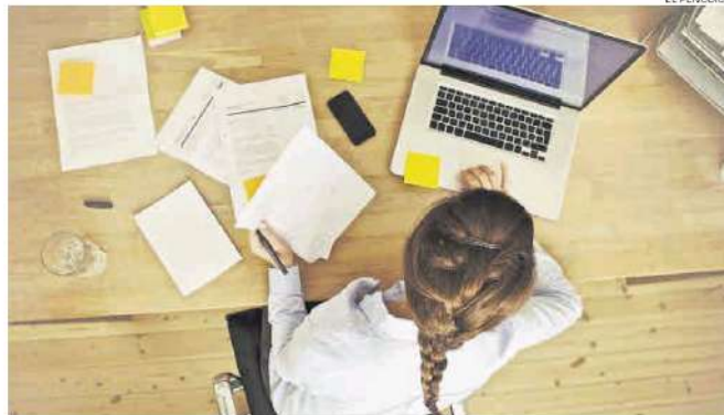
Un mujer realiza gestiones con su ordenador portátil.

«Tenemos unos costes desorbitados, pero es que además somos