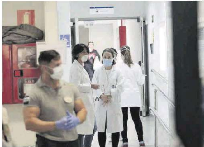
Profesionales sanitarios en un centro de salud.

Tal y como detalla en nota de prensa, la variante ómicron ha provocado «un verdadero tsunami» de bajas laborales durante