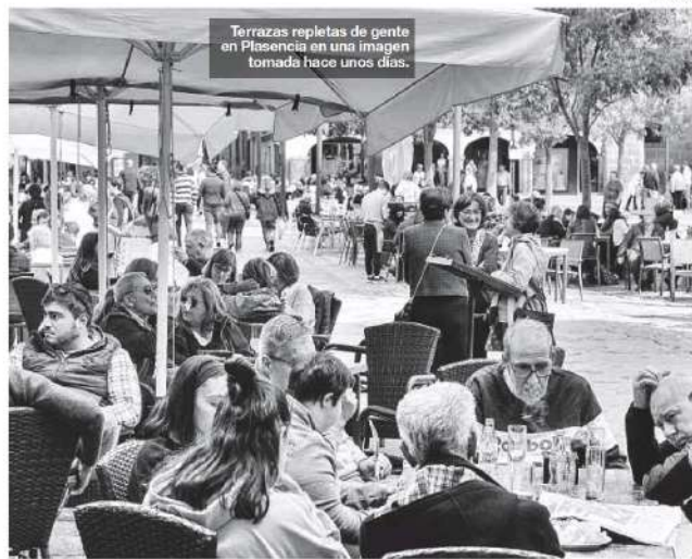
Terrazas repletas de gente en Plasencia en una imagen tomada hace unos días.