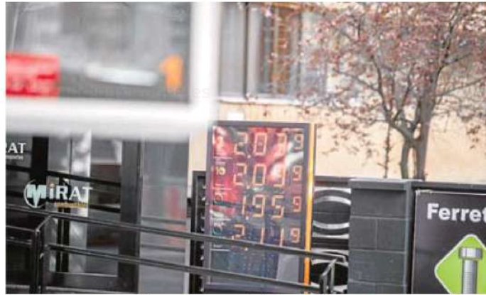
Gasolinera de Cáceres que vendía ayer carburantes a más de dos euros el litro. JORGE REV

A este espacio corresponde la imagen que acompaña a esta información. En sus tablas de precios se recoge que el gasoil se dispensa a 2,03 euros el litro y el gasoil premium a 2,09. La gasolina 98 también ha superado ya la barrera de los dos euros y se sitúa ya en 2,11 el litro. Se ha alcanzado así máximos históricos, ya que son valores que no se habían visto nunca. La gasolina 95, en cambio, se