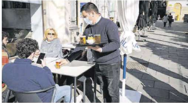
Un camarero sirve a los clientes en una terraza de un bar de Badajoz.

REIVINDICACIONES / Aunque ninguno detalla todavía sus propuestas, los tres sindicatos coinciden en que su principal reivindicación irá en la línea de actualizar los salarios de los trabajadores de la hostelería pacense con respecto al incremento del 6,5% con el que el Índice de Precios de Consumo (IPC) ha cerrado 2021. «Debemos dignificar las condiciones de un sector que está muy precarizado y que, además, ha sido uno de los más afectados por la pandemia, tanto por la inactividad como por las