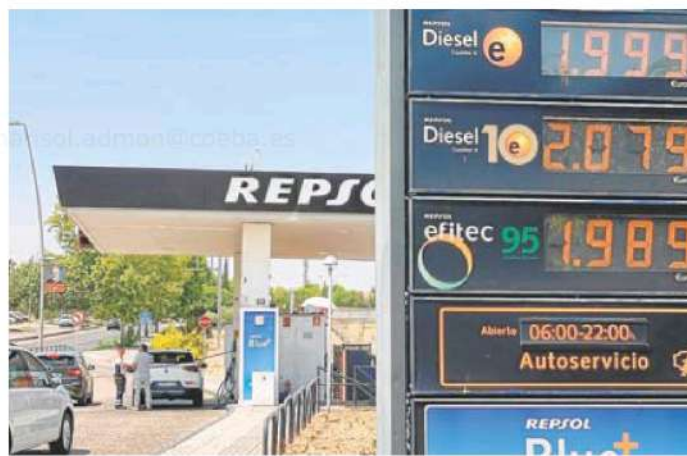
Clientes en una gasolinera de Mérida con el precio del litro de diésel otra vez por debajo de 2 euros.

En concreto, en abril se alcanzó un consumo de 9.500 toneladas de gasolina 95 y 60.700 de gasóleo A, que son los dos tipos de combustible más vendidos en la región. En el primer caso, su-