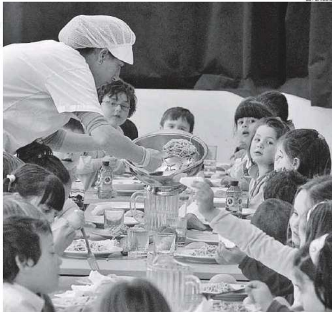
Una cocinera sirviendo a los niños usuarios de un comedor escolar.

Las patronales del sector ya han planteado en algunas comunidades como Cataluña o Andalucía la necesidad de actualizar los precios de los comedores escolares para que el servicio sea viable después de que la cesta de la compra se haya encarecido más de un 6% en España. En el caso de Extremadura, desde la Consejería de Educación explican que no se tiene previsto modificar los precios públicos de estos servicios, cuya última actualización se fijó con la aprobación de la ley de presupuestos autonó-