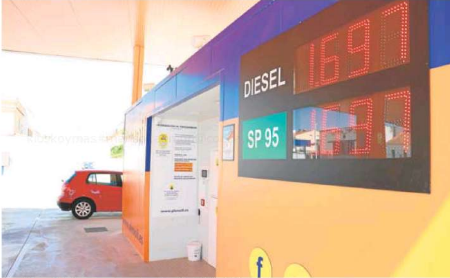
Los surtidores más baratos se encuentran en la gasolinera Plenoi de Don Benito. ESTRELLA DOMEQUE