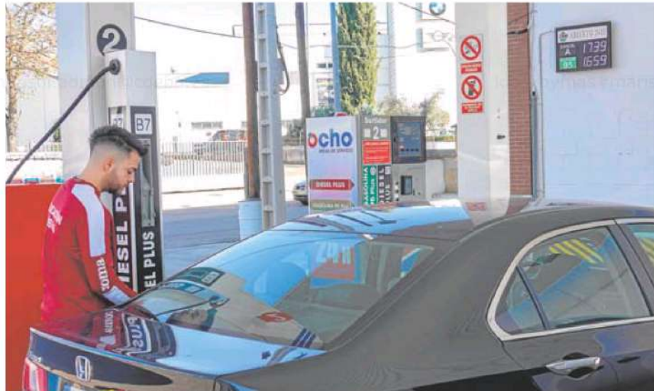
Un conductor reposta en una gasolinera de Badajoz.

En un vehículo diésel, por su parte, repostar cuesta 16,15 euros menos. Ha pasado de 105,65