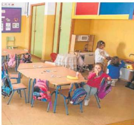
Niños en una clase de Infantil. HOY

Así, en Cáceres, el 91,6% de los alumnos ha obtenido plaza en el centro elegido como primera opción, porcentaje que es del 94,85% en Badajoz, del 85% en Mérida y del 88% en Almería.