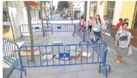
Las vallas que cercan el socavón ocupan más de la mitad de la calle. J. V. A.

En el último consejo municipal de comercio, celebrado el mes pasado, el presidente de los comerciantes pidió al Ayuntamiento que arregle el socavón de forma subsidiaria y que luego un juez aclare a quién corresponde pagarlo. «Si es a los vecinos, que el Ayuntamiento le pase entonces la factura, pero ahora que lo arregle, no podemos tener la prin-