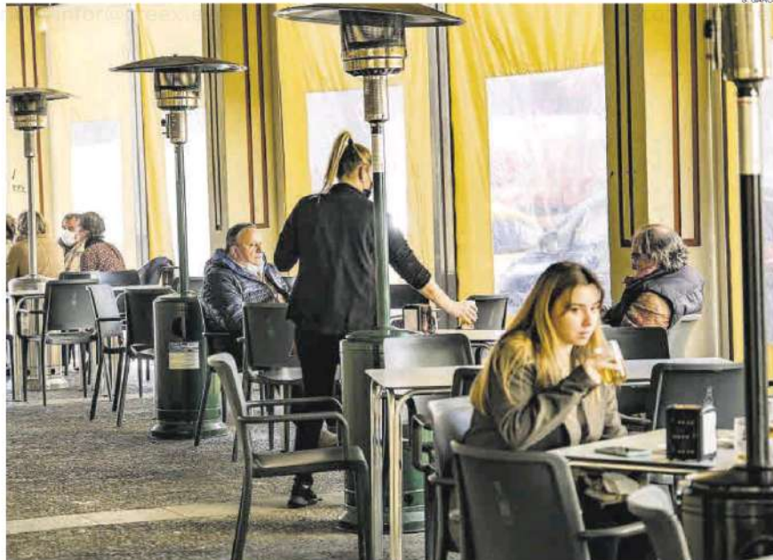
Hostelería. Clientes en el interior de un velador de un establecimiento hostelero de la ciudad de Badajoz.

El hostelero considera que la factura de la luz ha tenido que subir alrededor de un 30% de media: «Hay que tener en cuenta que no podemos sectorizar el uso de muchos equipamientos como las cámaras frigoríficas, el aire acondicionado y la calefacción». «Ahora encima nos viene