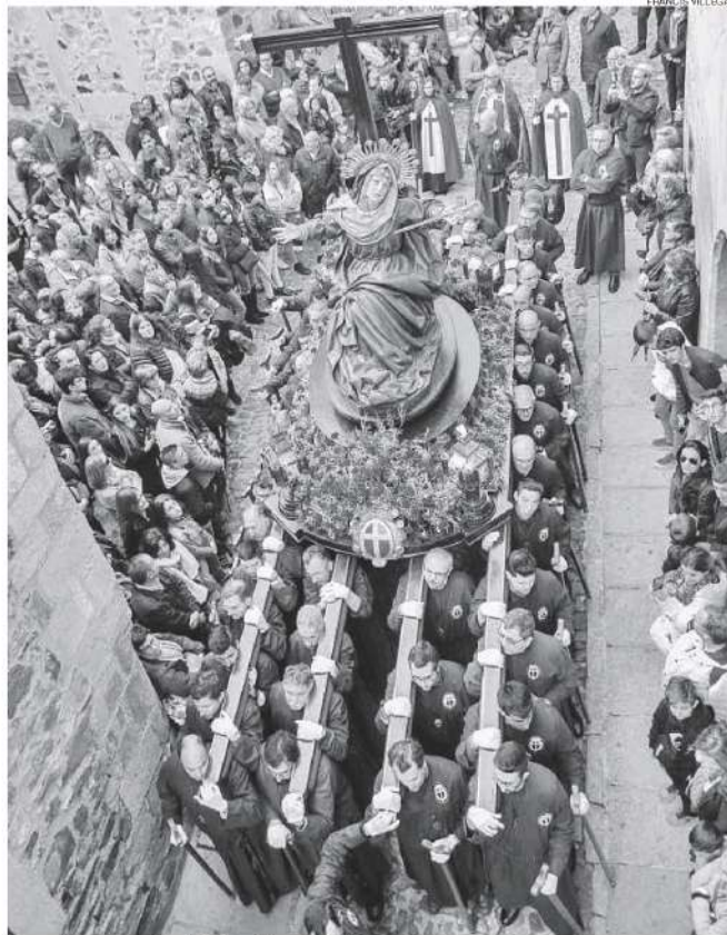
Imagen de una procesión celebrada en Cáceres en 2019.