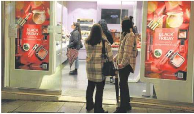
Varias jóvenes, ante las puertas de un comercio en Mérida.

centro vacías». Se refiere a lo que allí se conoce 'la avenida', que comprende la avenida de la Constitución y la calle Ramón y Cajal, con una hilera de tiendas muy variada. «La estrategia que se aplica la mayoría de comerciantes por el Black Friday en Don Benito es ampliar el plazo de devoluciones y permitir los cambios hasta el 11 de enero para facilitar así que los clientes anteipen las compras navideñas», explica Casado.