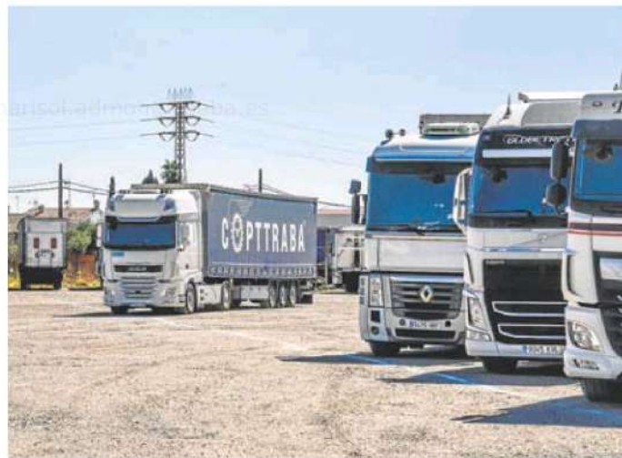
Camiones aparcados en Gévora.

Por el contrario, en los últimos doce meses, el número total de afiliados a la Seguridad Social en la sección de 'Transporte y Almacenamiento' ha crecido un 3,5% en la región, según los datos analizados por Stratego. Es un incremento muy superior al