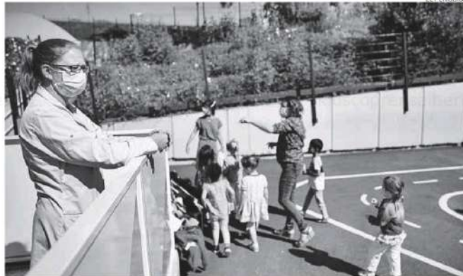
Profesores vigilando a los alumnos en el patio de un colegio.

La DGT ha informado de que no hay carreteras extremeñas cortadas para la Operación Especial de Semana Santa, aunque las vías más afectadas serán la A5 y la A66, en ambas provincias, y la N-430 y la N-432 en territorio pacense y la Ex-A1 en Cáceres.