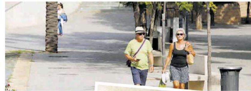
Dos personas caminan por la calle en manga corta en pleno octubre. Abajo, escaparate de una tienda de ropa de Badajoz.