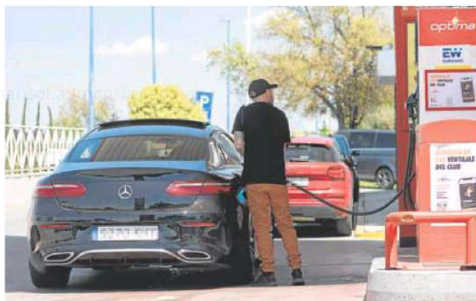
Un conductor reposta en una gasolinera.

En la provincia de Cáceres hay ocho estaciones de servicio con el litro por encima de ese umbral. Las cuatro más caras están en Miajadas, en la EX-A1, donde se paga a 2,059 euros, el mismo precio que se paga en la de Repsol