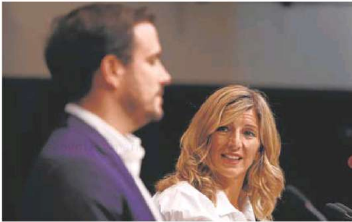
La vicepresidenta segunda, Yolanda Díaz, ayer, junto al ministro de Consumo, Alberto Garzón.