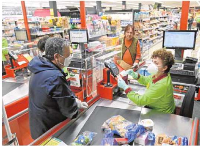
Los supermercados han sido considerados actividad esencial durante toda la pandemia. HOY

Por ello, defienden que se aplique un alta laboral automática en ausencia de síntomas una vez superados los siete días que establece actualmente el periodo de cuarentena, de forma que no sea necesario acudir a los centros de Atención Primaria para solicitarla.