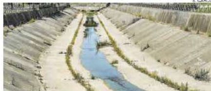
Cauce del arroyo Rívilas.