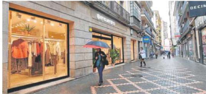
Una de las tiendas que se han abierto recientemente en la calle Cervantes.

El alcalde cree que poco a poco la ciudad ha ido recuperando la actividad económica a volu-