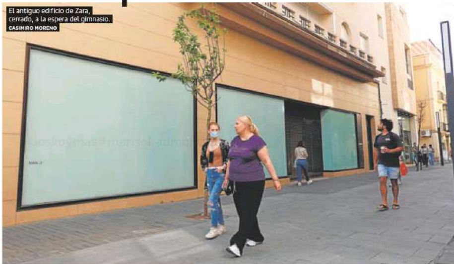
El antiguo edificio de Zara, cerrado, a la espera del gimnasio. CASINIRO MORENO

Los comerciantes y dependientes de Menacho se les enciende la mirada cuando oyen hablar de la posibilidad de que la red de gimnasios vinculada a Cristiano Ronaldo desembarque en su calle. La información adelantada por HOY este martes sobre las conversaciones entre CR7 Fitness by Crunch y la familia Ardila, propietaria del edificio, para abrir un gimnasio de varias plantas en el local del antiguo Zara genera expectación.