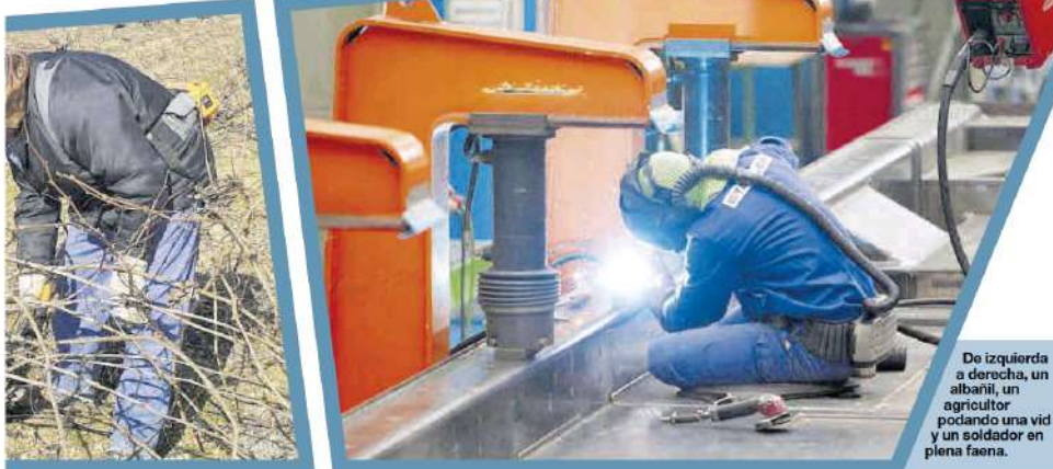
De izquierda a derecha, un albañil, un agricultor podando una vid y un soldador en plena faena.

En los últimos diez años, 1.401 personas han obtenido el certificado de competencia para el ejercicio de la profesión de transportista por carretera en Extremadura, 1.254 de ellas para mercancías y 147 para viajeros, conforme a los datos facilitados por la Consejería de Movilidad, Transporte y Vivienda extremeña. En el primer caso, el máximo de la década se alcanzó en el 2011, con 280. Un ejercicio después fueron menos de la mitad (114) y la cifra llegó a caer hasta los 21 en 2017. Si que hubo cierto repunte en las convocatorias de 2019 (con 196), y 2020 (238), si bien los exámenes de esta última fueron los celebrados el año pasado, tras haberse tenido que posponer a causa del covid. Además, señala Aza, «no todos los que se sacan el título ejercen, muchos se dedican a otras cosas o prueban y lo dejan por lo duro que es».