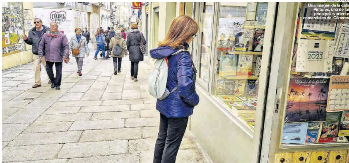
Una imagen de la calle Pintores, una de las principales arterias comerciales de Cáceres.

Más información en: www.elperiodicoextremadura.com