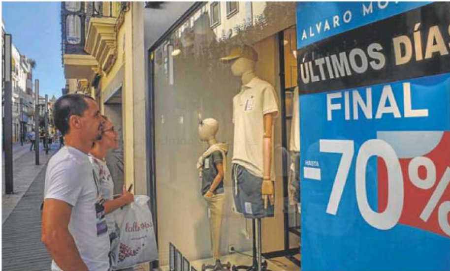
Dos clientes miran un escaparate en la calle Menacho. PAKOPÍ