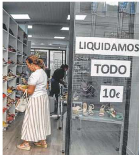
Una de las tiendas, con precio único en todos los artículos. PAKOPÍ

Los comercios especializados en trajes de fiestas y para eventos como las bodas, así como los de calzado y complementos, han