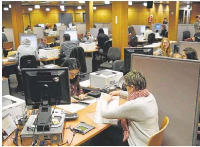
Imagen de una oficina de la Agencia Tributaria.

Desde Gestha estiman que más de ocho millones de personas se beneficiarán de los 200 euros a las familias, después de que el Consejo de Ministros haya aprobado un nuevo paquete de medidas entre las que se incluye un cheque de ayuda a la compra de