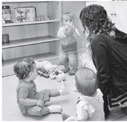
Alumnos del primer ciclo de Infantil en un centro.