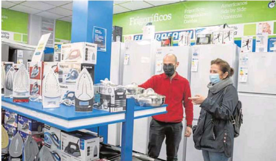
La empresa Electrocash ha llegado a tener a un 30% de sus trabajadores de baja. PAKOPI