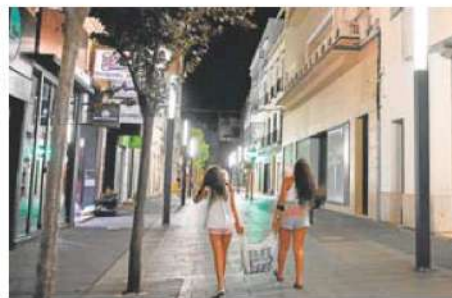
El local del antiguo Zara (derecha) vacío y a oscuras en Menacho. J. V. A.

Todo esto está haciendo que los comerciantes ya se replanteen abrir los primeros domingos del mes en el momento en que el gimnasio