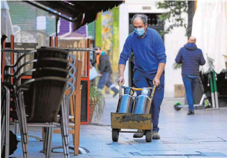
Un trabajador autónomo, preparando la apertura de su establecimiento. ÓSCAR CHAMORRO

Por ello, el Gobierno está manteniendo contactos con la Agencia Tributaria para configurar qué se entiende por rendimientos netos y se ha comprometido a mandar una nueva propuesta articulada. Además, las partes han acordado empezar a trabajar en la elaboración de un texto legal sobre la base del acuerdo fijado el de julio. Asimismo, los agentes sociales se han emplazado a enviar propuestas concretas adicionales. El próximo lunes, nueva reunión.