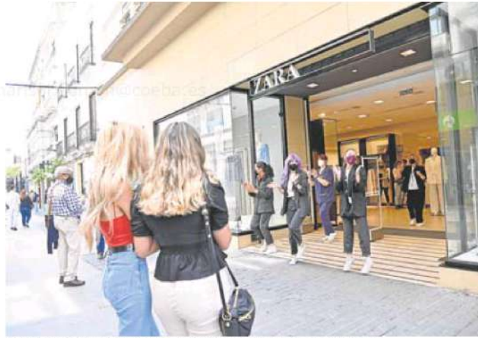
Aplausos de clientas y dependientas el día de cierre de Zara, el 15 de mayo pasado.

Desde que Inditex cerrara su buque insignia el 15 de mayo del año pasado, nada ha vuelto a ser igual. Los comerciantes lo notan y ansian una locomotora que vuelva a llevar clientes para que los