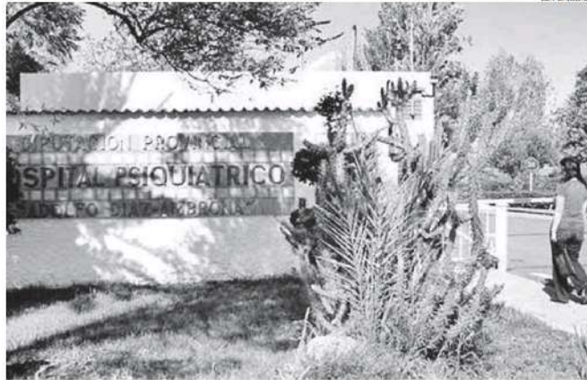
Entrada del centro sociosanitario de Mérida, en una imagen de archivo.

Por otra parte, avanzó que el nuevo contrato del servicio de seguridad incluye un aumento de los profesionales y de los sistemas de videovigilancia en algunas zonas, además de reforzar los botones de pánico para que el aviso a los vigilantes sea lo más rápido posible. Granados respondió así a