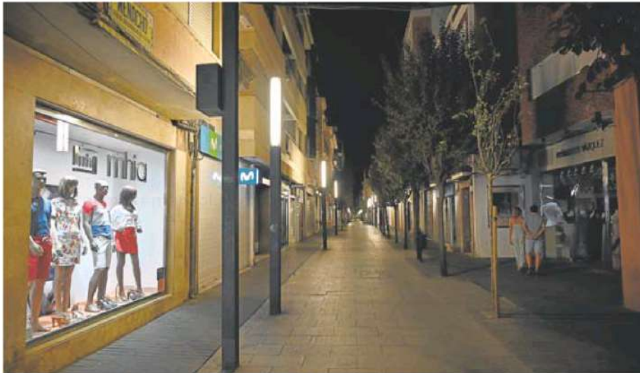
El apagón de los escaparates llegó a la calle Menacho el miércoles por la noche, con alguna excepción. JOSÉ VICENTE ARNELAS