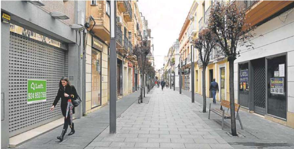
Locales en alquiler en la calle Menacho, donde tratan de recuperar el tirón tras el cierre de Zara.