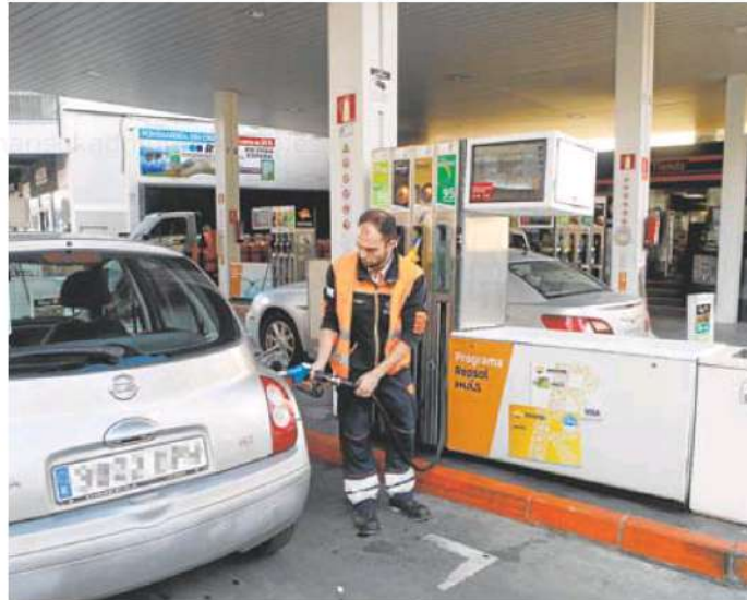
Un trabajador de una estación de servicios de Cáceres echando gasolina.

Temen que se repita lo que sucedió en el mes de abril, cuando se puso en marcha una de las medidas anticrisis por la subida de precios en el combustible, la de los 20 céntimos menos por litro al repostar. Eso provocó un desbarajuste en las estaciones de servicio. Afectó tanto a su organización como a sus cuentas. «En dos días tuvimos que cambiar los programas informáticos y no teníamos liquidez para adelantar el dinero. Fue un auténtico caos y tuvimos problemas para que nos devolvieran el dinero que habíamos adelantado», recuerda Mena.