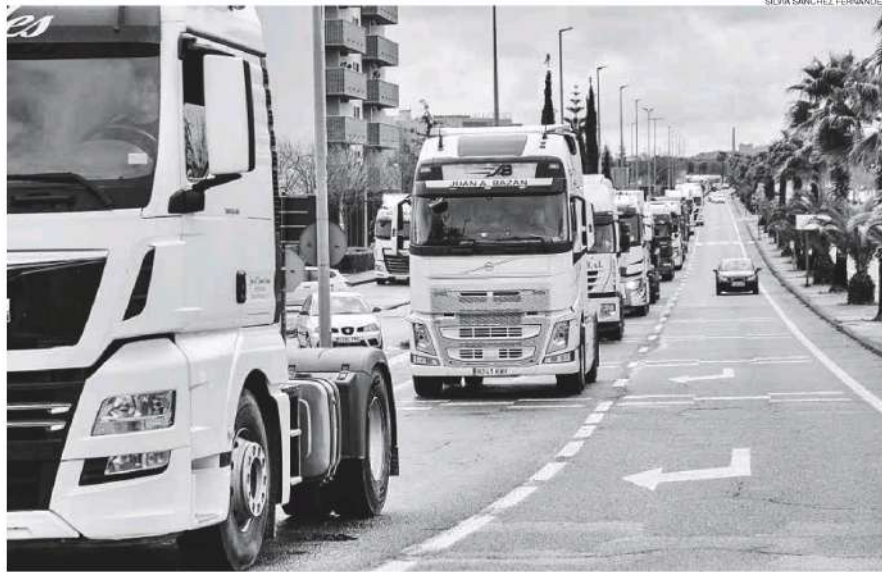
Caravana de camiones en la marcha lenta desarrollada ayer en Cáceres para protestar por la subida de precios de los combustibles.

«Las normas hay que cumplirlas e impedir realizar un trabajo es ilegal. Hay transportistas que sí quieren trabajar, que vienen de fuera, de otros países, realizando muchos kilómetros y que se encuentran con que no pueden entregar su mercancía», manifestó. En esta línea, la delegada destacó que el Ejecutivo central «trata de llegar a un consenso con las orga-