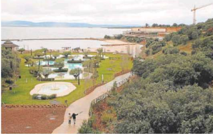
Vista parcial del complejo ubicado a hora y media en coche de Madrid. hoy