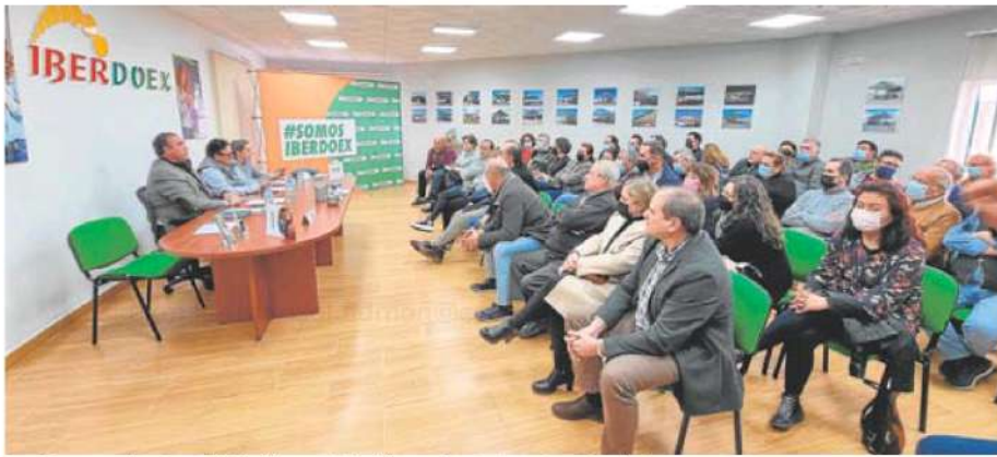
Reunión, ayer por la tarde en Mérida, de los asociados del grupo de estaciones de servicios Iberdoex. J. M. ROMERO