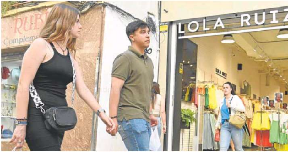
Una pareja ayer, paseando por la calle Menacho de Badajoz.