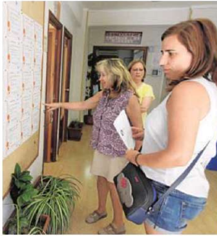
Unas alumnas consultan la lista de admitidos para un curso anterior. hoy

Otra novedad, en este caso en el aula de restauración, es un curso de cocina asiática, al tiempo que repite el de cocina extremeña y alentejana, junto a cursos de arroz y pinchos, nutrición y cocina saludables, cata vinos y productos gourmet; el aula de historia incluye dos acciones 'Badajoz historias singulares' y 'Badajoz calle a calle'; el aula de artes escénicas nuevas tendencias de