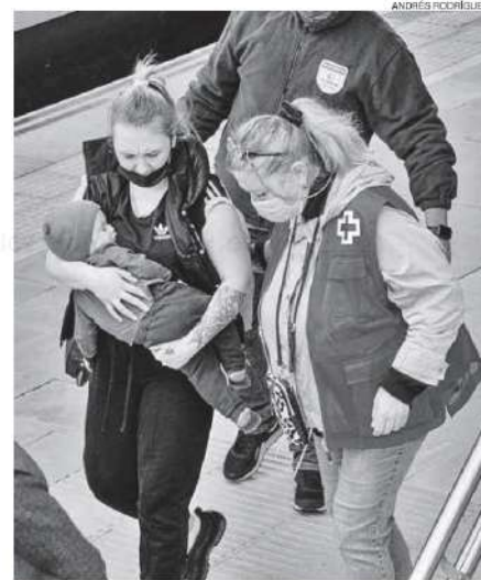
Una madre con su bebé llega a la estación de Badajoz.

Para hacerlo posible, Cruz Roja ha movilizó a más de 2.100 personas voluntarias que participan en tareas de logística, traducción, cobertura de las necesidades básicas, información jurídica o atención a la infancia, entre otras. =