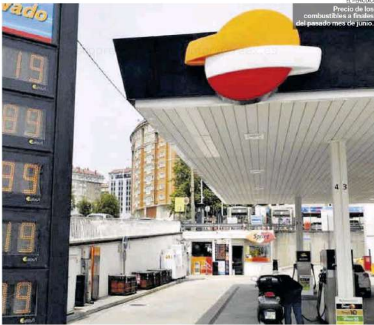
EL PERIÓDICO Precio de los combustibles a finales del pasado mes de junio.

Más información en: www.elperiodicoextremadura.com