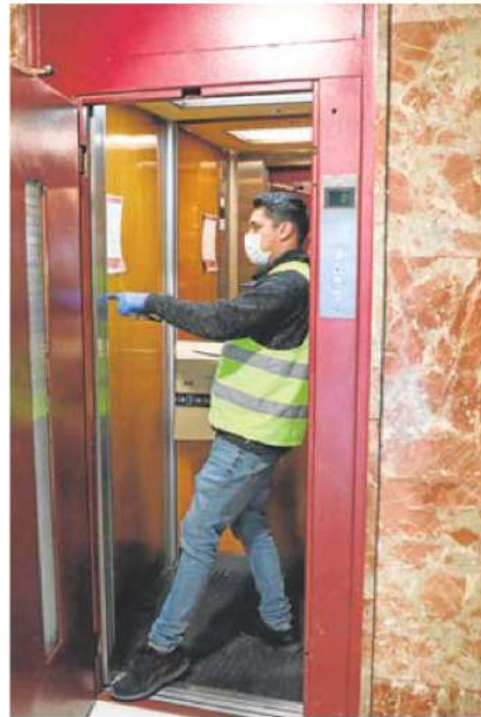
Un operario repara un ascensor en una comunidad de vecinos.

Algunas comunidades de Badajoz reducirán su remanente de 15.000 euros a 5.000 y ellos subrayan que es necesario reponer el dinero para hacer frente a reparaciones extraordinarias con rapidez.