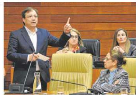
Fernández Vara en su respuesta a los grupos parlamentarios.

Fernández Vara recordó que fue un gobierno del PP el que dejó caducar el estudio informativo del tramo Madrid-Oropesa. En cuanto a las mercancías, aseguró que los grandes proyectos que se implantarán en la región «vienen por el tren». Respecto al Pacto por el Ferrocarril, afirmó que estudiará invitar a las plataformas sociales.