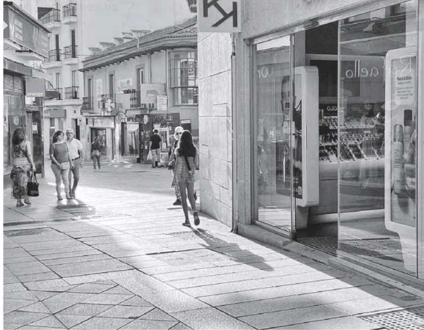
En Mérida ▶ Puerta automática en un comercio de la calle Santa Eulalia de la capital extremeña.