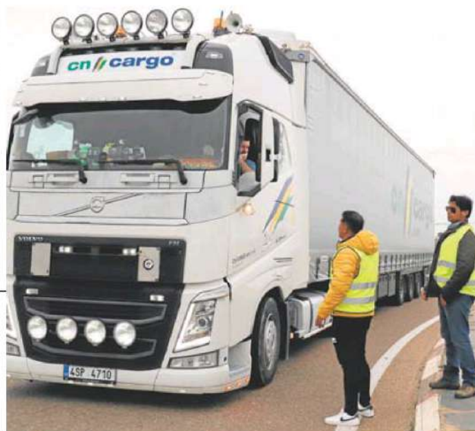
Algunos transportistas mantuvieron ayer algunos de los piquetes informativos en Don Benito.