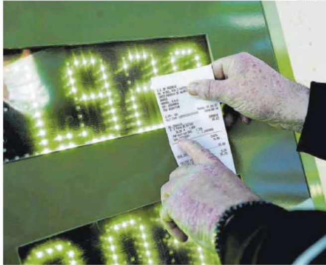
Un cliente comprueba el descuento realizado en su tique de compra de combustible.

La delegada del Gobierno en Extremadura, Yolanda García Seo, destacó ayer por su parte que las gasolineras extremeñas van a recibir «en un tiempo récord» el dinero adelantado para aplicar el descuento de 20 céntimos. =